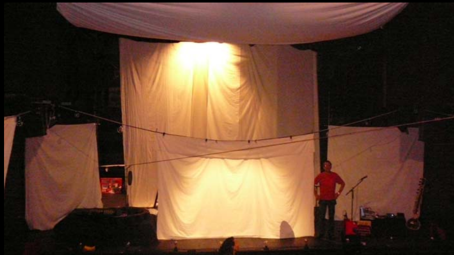
Escenario visto desde la platea

Escenografía montada en el Teatro "Divadlo Celetné" en Praga. Republica Checa.