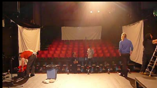
Platea vista desde el escenario

Las sábanas actúan como pantallas donde se ven las sombras producidas por los artefactos luminosos y linternas de mano. Proyectadas desde el centro de la platea.