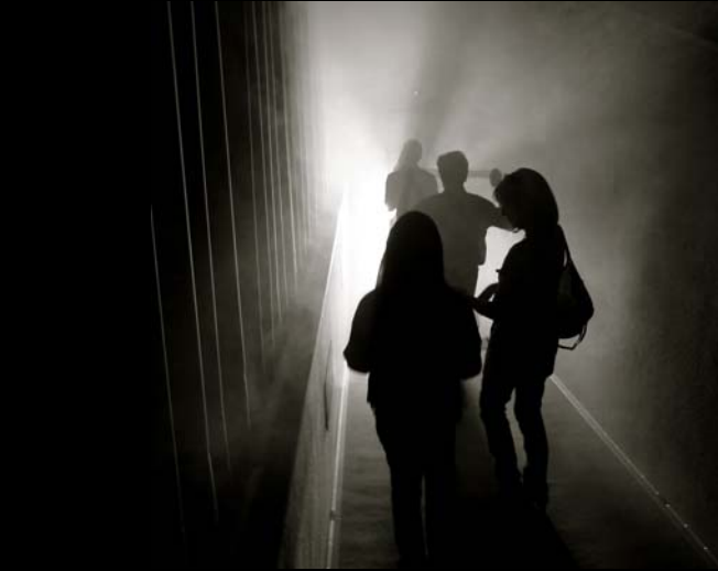
El público camina hacia la luz