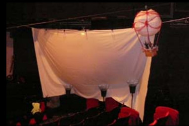
Lateral del patio de butacas