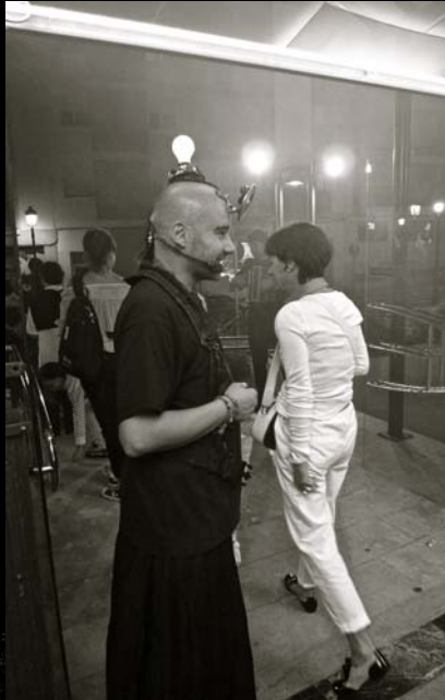
KM despide al público en la puerta